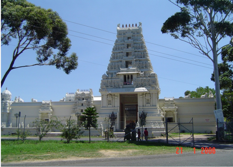
ಶ್ರೀ ವೆಂಕಟೇಶ್ವರ ದೇವಾಲಯ, ಹೆಲೆನ್ಸ್ ಬರ್ಗ್ , ಆಸ್ಟ್ರೇಲಿಯ

ಈಗ ಸುಮಾರು ಹತ್ತು ವರ್ಷಗಳಿಂದ ಸಾಕಷ್ಟು ಕನ್ನಡಿಗರೂ ವಲಸೆ ಬಂದಿರುವುದರಿಂದ, ಕನ್ನಡಿಗರೆಲ್ಲಾ ಒಟ್ಟುಗೂಡಿ, ದೇವಸ್ಥಾನದ ಕಟ್ಟಡಕ್ಕೂ ಅನುಕೂಲವಾಗಲೆಂದು ದೇವಸ್ಥಾನದಲ್ಲಿ ಉಗಾದಿ ಹಬ್ಬ ಬಹಳ ವಿಜೃಂಭಣೆಯಿಂದ ಆಚರಿಸುತ್ತಿರುವೆವು. ಎಲ್ಲೆಲ್ಲಿ ನೋಡಿದರೂ, ಬಗೆಬಗೆಯ ಬಣ್ಣ ಬಣ್ಣದ, ಕುರ್ತಾ ವೈಜಾಮ, ಕಂಚಿ, ಮೈಸೂರು ಸೀಲ್ಟ್ , ಪಾರ್ಟಿ ಸೀರೆಗಳು, ಪಂಚೆ, ಶಲ್ಯ, ಮಗುಟಗಳೂ ಮಿಂಚಿ ಮಿರುಗುತ್ತಿದ್ದು ಹಬ್ಬದ ಕಳೆ ಕಟ್ಟಿತ್ತು. ಸೇರಿದ್ದವರೆಲ್ಲಾ ಉಗಾದಿ ಶುಭಾಶಯಗಳನ್ನೂ ಪರಸ್ಪರ ಹಂಚಿಕೊಳ್ಳುತ್ತಿದ್ದರ ಸಂಭ್ರಮ ಹೇಳಲುತೀರದು!!